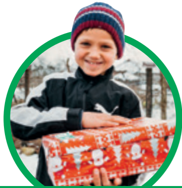
EINLADUNG ZUM GLAUBEN